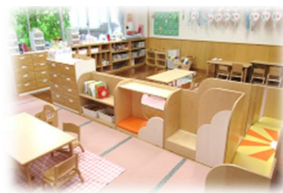
1歳児2歳児クラスのお部屋

一人一人の成長に合わせた、手作りの温かい食事です。四季折々の食材に親しみながら、食への意欲を育てます。