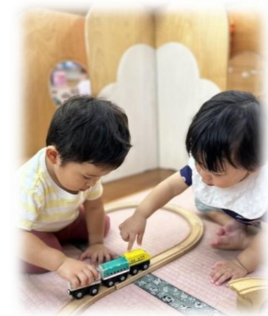
室内遊びは 広々としたおゆうぎ室でも