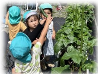
みんなで育てたお野菜は 美味しさもひとしお