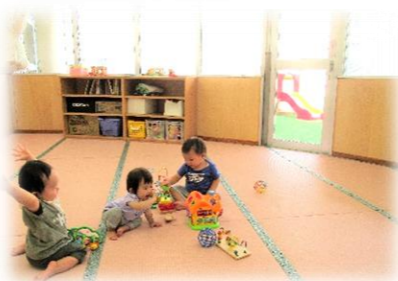
0歳児クラスのお部屋

安心できる環境の中で生活リズムを整えながら、保育士やお友達とのふれあいやコミュニケーションを通して、健やかな心と体を育てていきます。